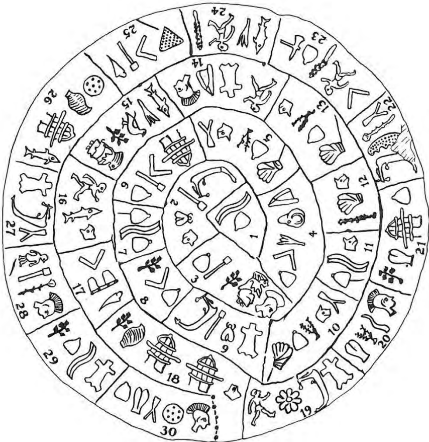
Diskos von Phaistos Seite B