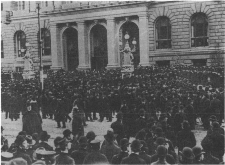
Wahlrechtsdemonstranten vor dem Preußischen Abgeordnetenhaus, 1908

In einigen wenigen Fällen kommt es sogar zur direkten, wenn auch gewaltlosen Konfrontation mit dem Protestgegner. "Als Bülow in seiner Karosse anfuhr, mußten seine gefürsteten Ohren den Wutschrei des Volkes vernehmen", heißt es im Parteitagsbericht über die Wahlrechtsdemonstration vor dem preußischen Landtag am 10. Januar 1908: "Die Abgeordneten mußten sich einen Weg durch die dichte Menge bahnen, wobei den Vertrauensmännern der Junker und Geldsackkapitalisten die Rufe 'Hoch das freie Wahlrecht', 'Heraus mit dem Reichstagswahlrecht für Preußen', 'Her mit dem Frauenwahlrecht' in die Ohren gellten. Männer und Frauen schwenkten das Extrablatt des 'Vorwärts' hoch, in dem es hieß: 'Das Volk ist auf dem Plane.' - 'Lernet, Ihr seid gewarnt.'" 30 So direkt und körperlich-bedrängend wird die "Warnung" damals selten übermittelt: Meist müssen sich die Demonstranten damit begnügen, ihre Gegner in effigie zu attackieren. Insbesondere Bismarckdenkmäler dienen als Ersatzobjekte, wobei es freilich nicht zur "Gewalt gegen Sachen" kommt, sondern es bei der symbolischen