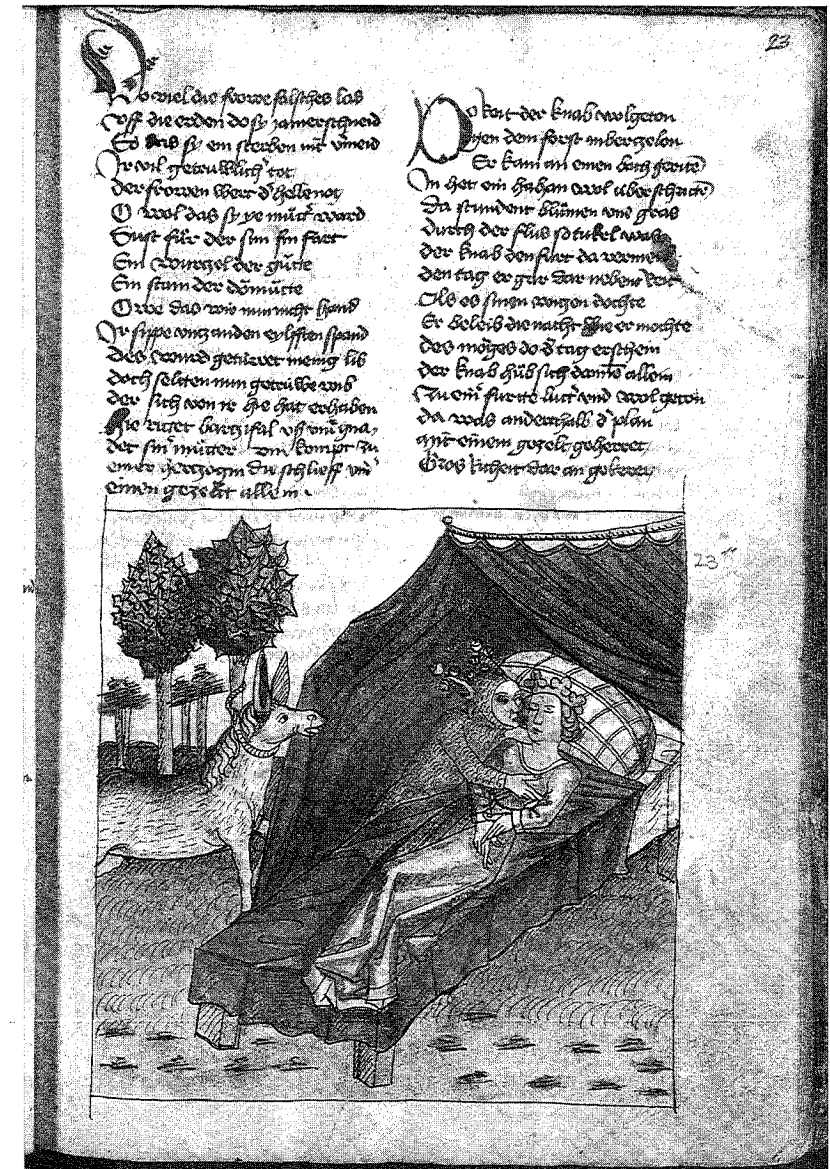
Abb. 1: Bern, Burgerbibliothek, Cod. AA 91, Bl. 23r. (Wolfram von Eschenbach, Parzival)