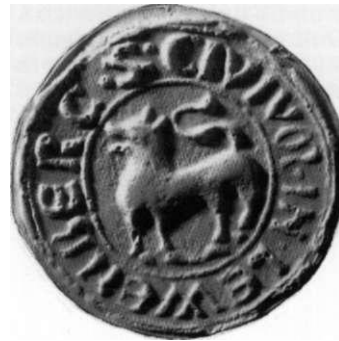
Das älteste bekannte Siegel der Stadt Leonberg aus dem Jahr 1312 - der Löwe auf einem Berg.

Weil der Stadt waren dies Böblingen, Sindelfingen und Heimsheim sowie Stuttgart, das - eine Gründung der Markgrafen von Baden - über Graf Ulrichs erste Frau Mathilde von Baden um 1250 in den Besitz der Württemberger kam. Das Hinterland Leonbergs blieb deshalb im Mittelalter und der frühen Neuzeit immer relativ klein. Es erstreckte sich ungefähr rechteckig um Leonberg herum mit den am weitesten entfernten Orten Weilimdorf im Osten, Malmsheim im Westen, Hirschlanden im Norden und Warmbronn im Süden. 16