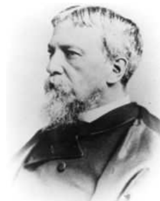
Abb. 3 Silas Weir Mitchell