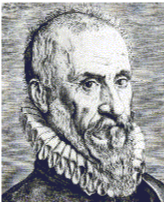
Abb. 2 Ambroise Paré