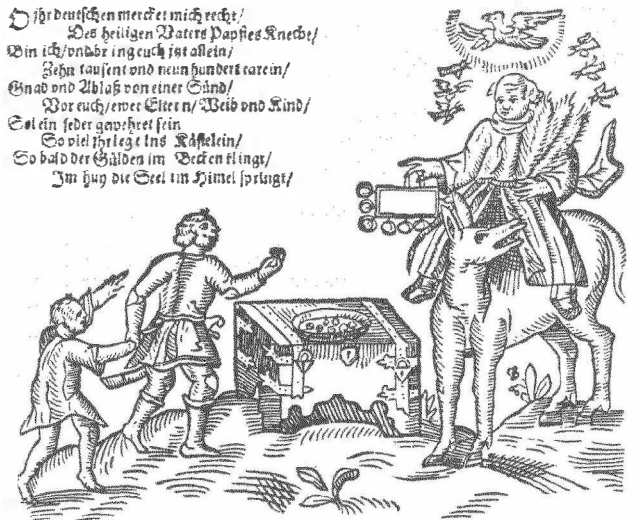
Spottbild zu Johannes Tetzels Ablasshandel (Zeitgenössischer Holzschnitt)

Ihr deutschen mercket mich recht! Des heiligen Vaters Pappstes Knecht/ Din ich/ond dör ing euch ist allein/ Behn tausent ond neun hundert carein/ Gnad ond Ablass von einer Sünd/ Vor euch/erwe Eitern/ Weid ond Kind/ Sol ein jeder gow/hret sein So viel ihr leg e ins Kasselein/ So bald der Hälben im Becken klinget/ Im hup die Seel im Hime! springt!