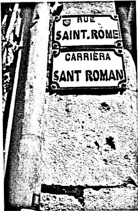
Toulouse St. Romanus