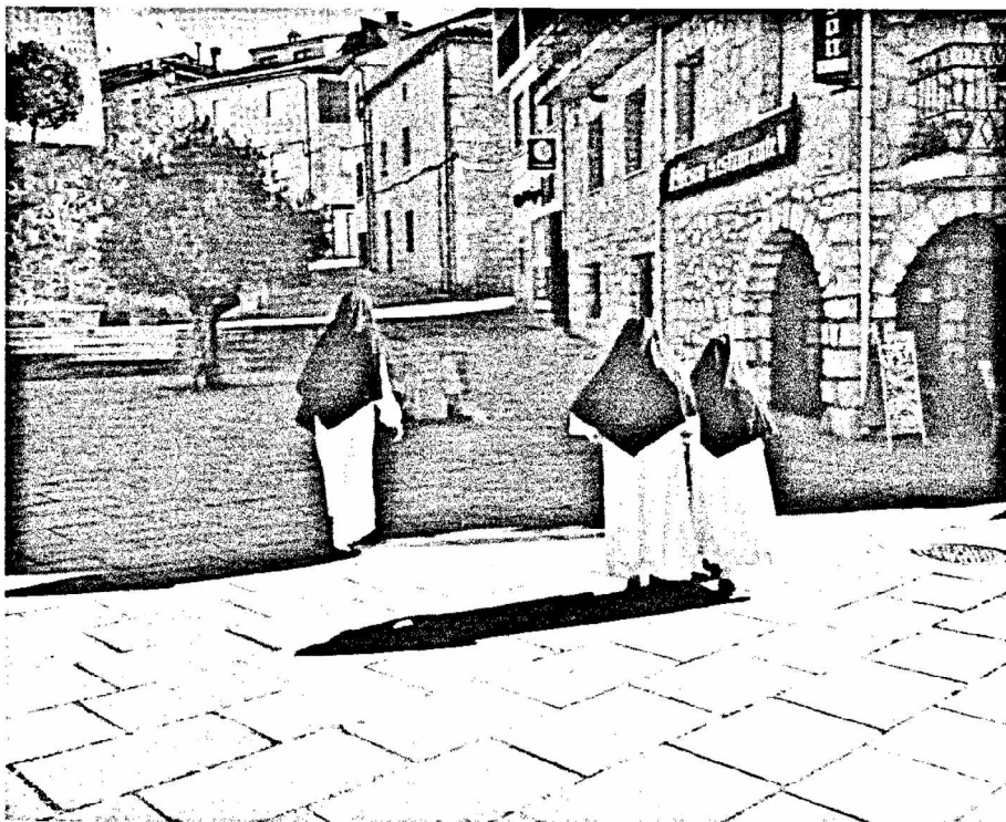
Moniales in Caleruega

Das Institut M.-Dominique Chenu unterwegs auf den Spuren des Ordensgründers