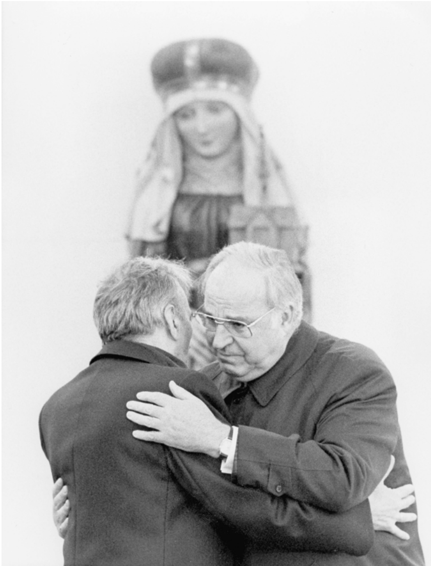
Abb. 2: Der Friedensgruß von Mazowiecki und Kohl vor der Statue der Hl. Hedwig