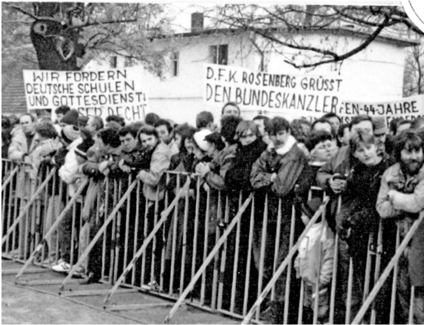
Abb. 4: Gottesdienstbesucher in Kreisau mit deutschen Transparenten

Industriegebiet her, der auch polnisch konnotiert war. Dass hier aber Schlesien aus dem Opperler Schlesien Helmut Kohl auf einem ehemaligen Gutshof in Niederschlesien begrüßten, ließ Schlesien zu einem ganzheitlichen Raum imaginierter Gemeinschaft werden: Es ging nicht so sehr um die konkreten Lebensorte der angereisten Gruppen, sondern um eine Selbstmanifestation von »Schlesien« an sich in einem Gebiet, dessen Bewohner sich großenteils national anders verorteten. Waren nämlich das Opperler Schlesien und das oberschlesische Industriegebiet auch während der Volksrepublik durch eine deutsche Minderheit bzw. eine national-ambivalente, in staatssozialistischer Diktion als autochthon bezeichnete Bevölkerung geprägt, hatte die Zwangsmigration der Deutschen von 1945 bis 1947 Niederschlesien zu einem fast vollständig polnisch besiedelten Gebiet werden lassen 107 . Auch wenn die sinn-