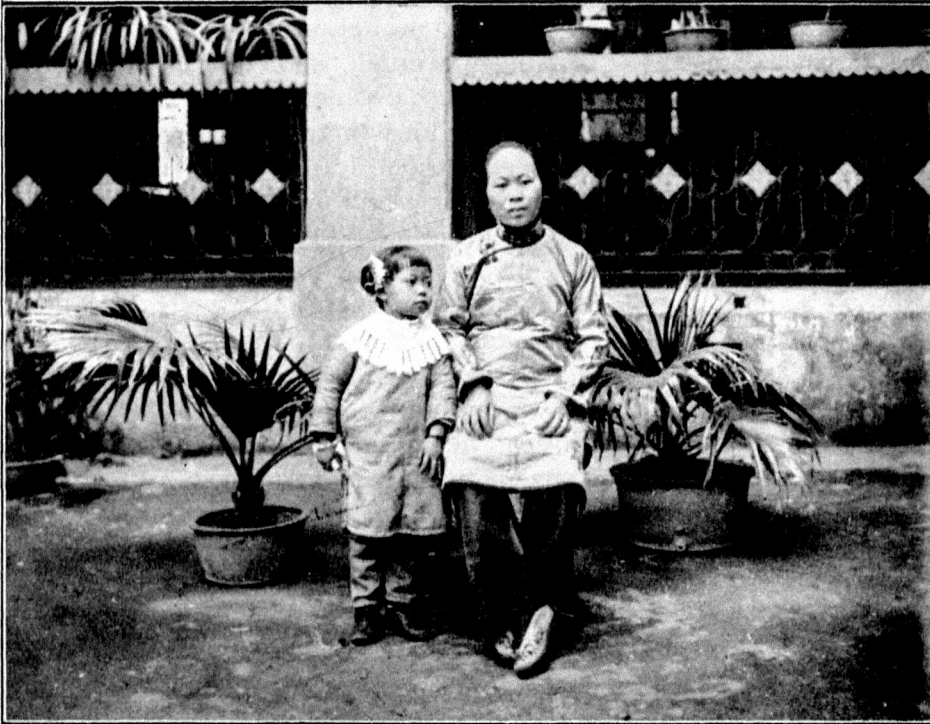
Missionslehrerin in Süddhina.

Eine in dem Findelhaus des Berliner Frauenmissionsvereins für China aufgezogene und dort auch als Lehrerin ausgebildete Chinesin, die mit ihrem einen Töchterchen die Heimat besucht. Sie selbst ist so recht ein Beweis für die Notwendigkeit und den Segen der Missionsarbeit an den chinesischen Mädchen, denn sie war als Säugling ausgesetzt worden, weil sie „nur“ ein Mädchen war, das man nicht gebrauchen konnte. — Nun ist sie verheiratet mit einem christlichen Lehrer. Er hat eine Knabenschule, sie eine viel größere Mädchenschule auf Hongkong. Wenn sie gerade eins ihrer Mädchen, nicht einen ihrer Söhne, so festlich angezogen mit zum Besuch bringt, so liegt auch darin ein Bekenntnis zu dem, vor dem kein Unterschied ist zwischen Mann und Weib; und ihre Mädchenschule sucht das noch weiter zu tragen —