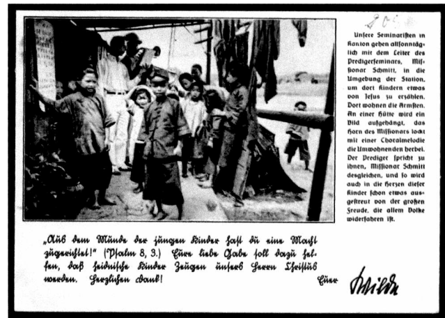
Abb. 2: Kindergottesdienst der Seminaristen.

Die Betrachter*innen sehen die Armut, auf die der Text abhebt, oder meinen, sie zu sehen, und sie sehen im Hintergrund den Missionar, der mit dem „Horn“, wie es im Text heißt (abgebildet ist eine Trompete), zur Evangelisation ruft. Das Horn wird als biblisches Instrument wahrgenommen, mehr noch als die Trompete, und als christliches Instrument. Dies wird kontrastiert mit der behaupteten Armut der Bevölkerung vor Ort und ihrer Bedürftigkeit. Die Kinder bilden das Bindeglied zwischen beiden; auf ihnen ruht die Hoffnung der Mission, sie sollen „Zeugen“ und „eine Macht“ Gottes werden, so der Dankestext. Die Karte unterstreicht die Bedeutung der Mission für die Menschen, die Bedeutung der Kinder für die Mission, und sie zeigt wieder exotisierend, wie „anders“ das Leben und deshalb auch die Missionsmethode in China ist, verglichen mit Deutschland.