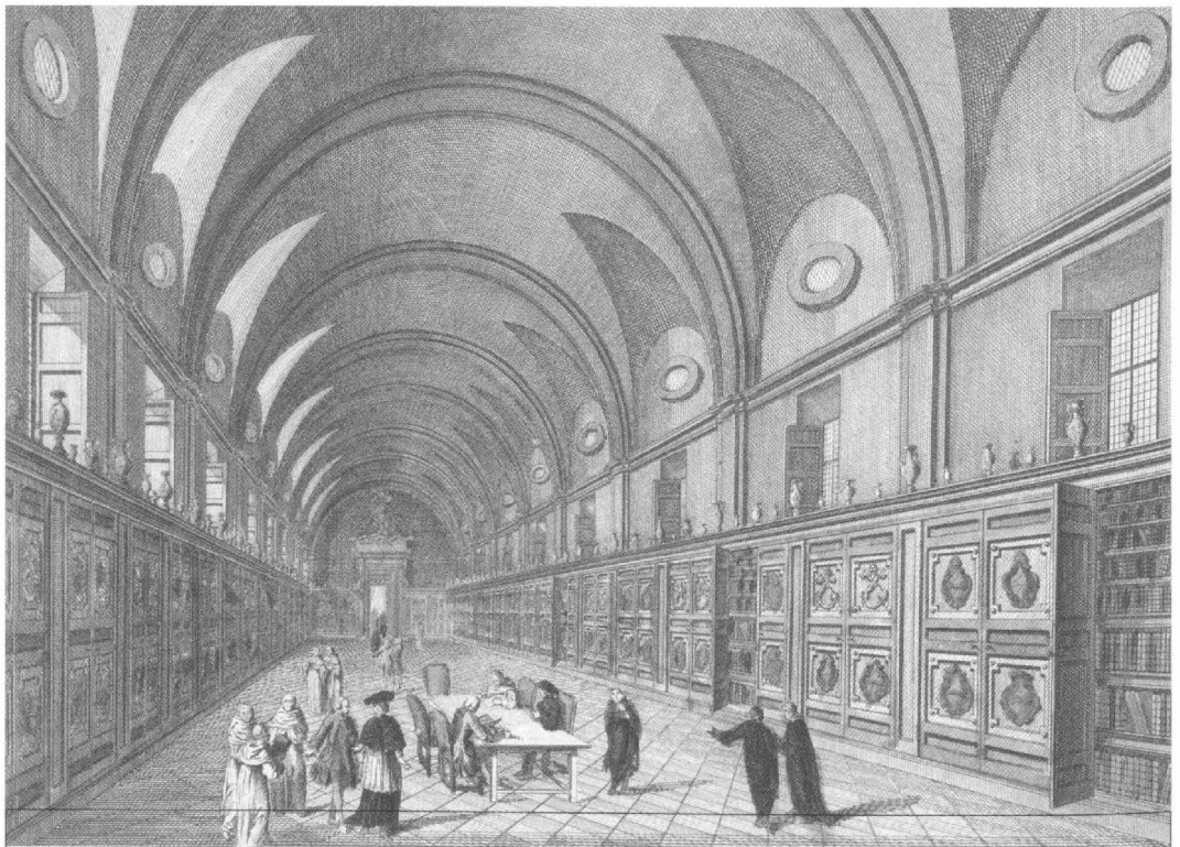
Quellen des Kirchenforschers: die Archive des Heiligen Stuhls (Im Bild: Biblioteca Apostolica Vaticana um 1780).

Waren also die Katholiken doch alle Antisemiten und die katholische Kirche als solche eine jüdenfeindliche Institution, wie jüngst Daniel Goldhagen behauptet hat? Verwundert angesichts dieses sogar liturgischen Antijudaismus das viel diskutierte Schweigen Pius XII. zum Holocaust wirklich? Passt das nicht