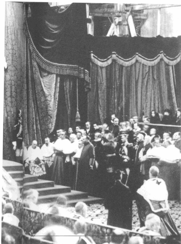
Die halbe Wahrheit: Das papstliche Dekret distanzierte sich nur pro forma vom Antisemitismus (Bild: Pius XI. im Sala Clementina des Vatikan, 1935).