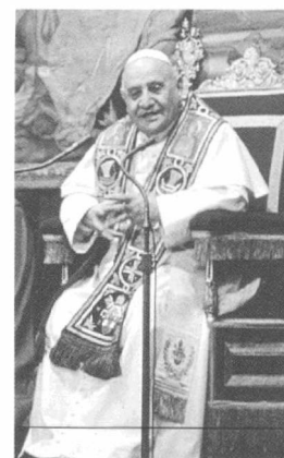
Reform mit 30 Jahren Verspätung: Johannes XXIII. sprach 1959 das neu formulierte Karfreitagsgebet.

Vielleicht hat die Kirche doch aus ihrer Geschichte gelernt. ◀