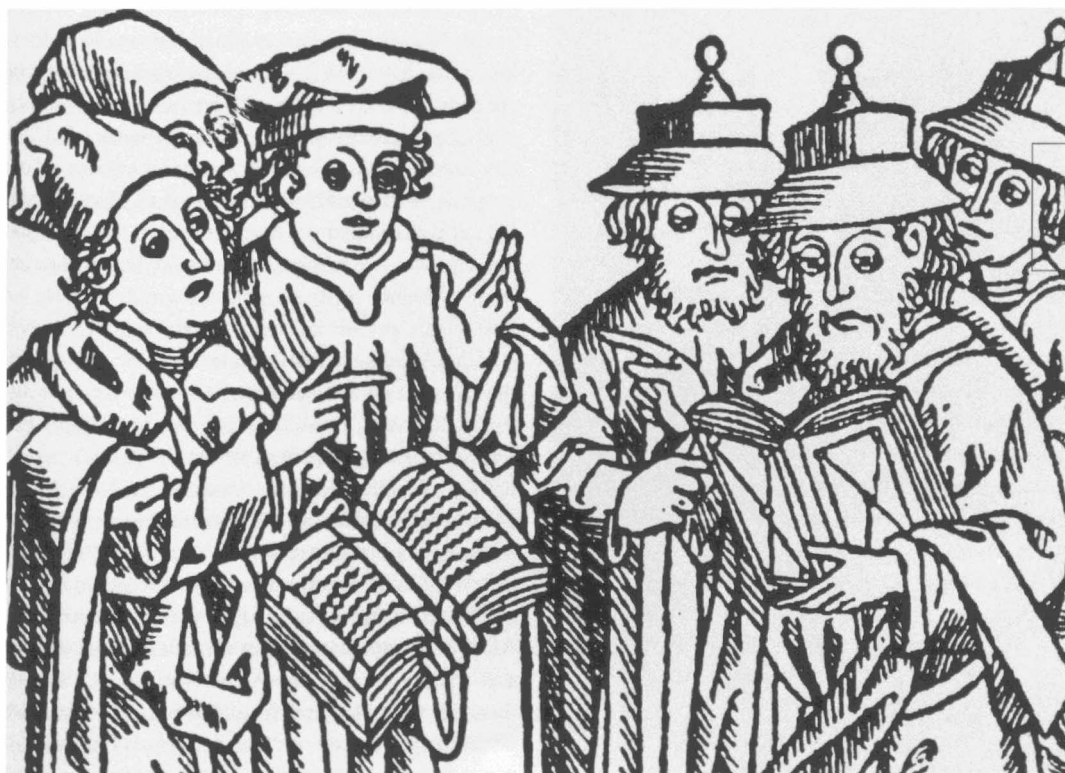
Christen und Juden. Auch die katholische Liturgie trug antisemitische Züge.

Es kann nämlich den Juden in keiner Weise vorgeworfen werden, dass sie in jener Nacht kniebeugend mit Jesus ihr Spottspiel getrieben hätten. Solches wird nämlich ausschließlich von den römischen Soldaten erzählt, die den Herrn Jesus im Kerker bewachten.