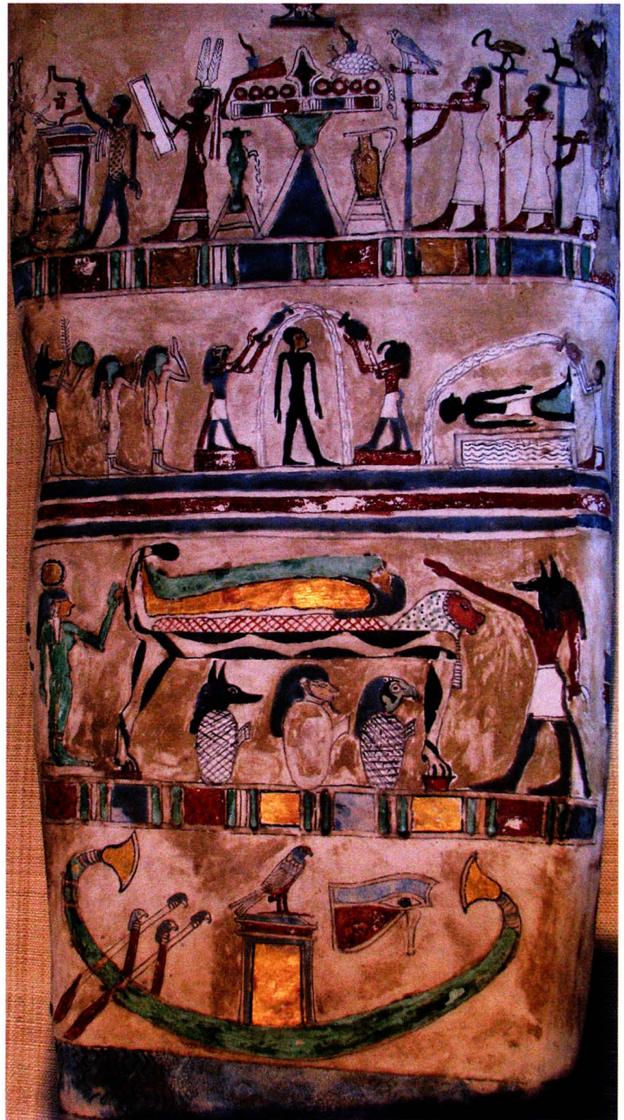
Detail eines ägyptischen Sarges (1. Jh. v. Chr.), El-Hibeh.