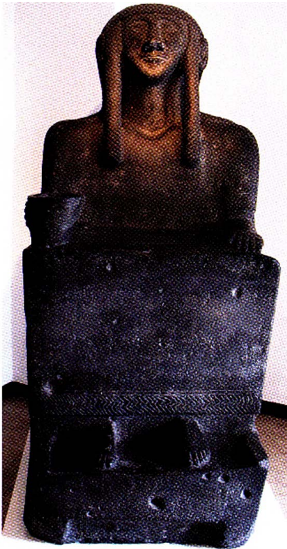
„Thronende Göttin“, Tell Halaf.

sammengefügt und 2011 im Berliner Pergamonmuseum der Öffentlichkeit präsentiert werden.