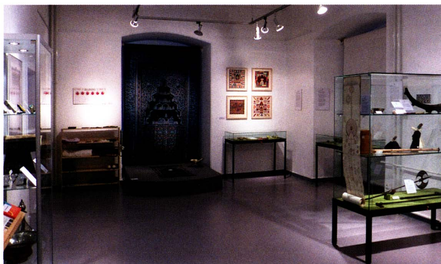
Blick in die Sonderausstellung „Von Derwisch-Mütze bis Mekka-Cola“.

Konstanze Runge) die zahlenmäßig geringen, aber bedeutenden Islamica des Hauses in den Blick, die durch etliche Neuanschaffungen zum Thema der religiösen Erziehung von Kindern ergänzt wurden. Ein Medienport ermöglicht einen multi-medialen Zugang und eine interaktive Vertiefung der Ausstellungsthemen.