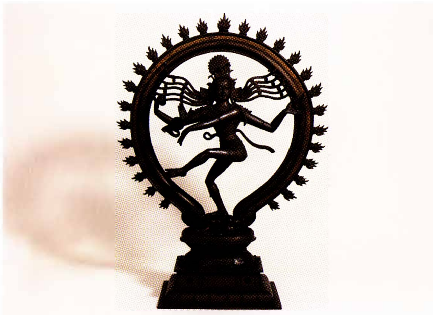
Shiva Nataraja, Madras.