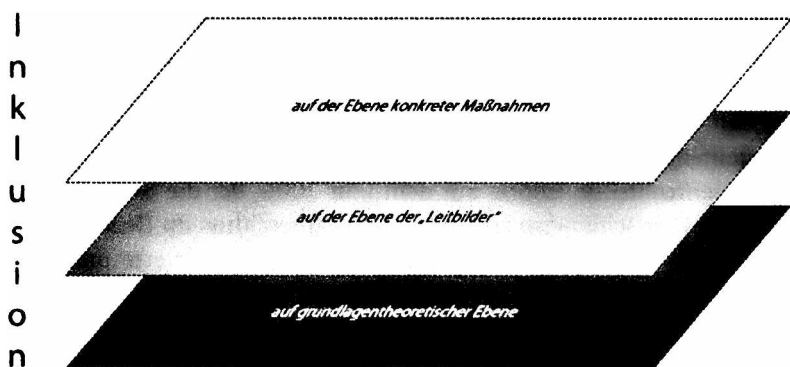
Abb. 1: Drei Verständnisebenen von Inklusion 2

Menschen nicht mehr voneinander separiert werden, so verhandeln andere unter Inklusion viel grundsätzlichere Fragen, z. B. welche Idee eine Gesellschaft vom guten Zusammenleben entwirft und wie sie diese begründet und umsetzt. 1 Inklusion steht damit für sehr unterschiedliche Verstehensweisen. Versucht man die gegenwärtige Debatte über Inklusion zu systematisieren, so fallen drei voneinander unterscheidbare, wenn auch ineinander spielende Ebenen des Verständnisses von Inklusion auf: 1. die grundlagentheoretische Ebene, 2. die mittlere Ebene der Regelungen in Form von Normen und Gesetzen und 3. die Ebene konkreter Maßnahmen.