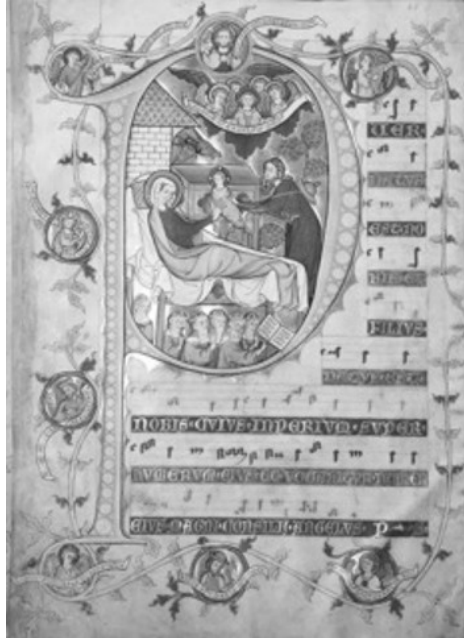
Weihnachtsinitiale des Codex Gisle – Bildnachweis: BAOs, Foto: Wachsmann, Hartwig

In der römischen Liturgie konzentriert sich die dritte Messe an Weihnachten, die Missa in die , auf die Fleischwerdung des göttlichen Logos um der Erlösung des Menschen und der ganzen Schöpfung willen. 43 Der Introitus-Vers lautet: „ Puer natus est nobis et filius datus est nobis – Ein Kind ist uns geboren und ein Sohn ist uns geschenkt“ (vgl. Jes 9,5). In der Initiale wird oben der göttliche Vater in einem Medaillon im Brustbild gezeigt. Er hält das „ EGO IPSE QVI LOQUEBAR ASSV[M] “ („Ich bin es, der sagt: Ich bin da“; vgl. Jes 52,6). Damit ist ein Querverweis auf Christus als Lamm Gottes gesetzt, wie es die erste Introitusinitiale des Codex zur Adventszeit präsentiert, auf der das Lamm von sich sagt: „ ECCE ASSUM MITTE ME “ („Siehe, hier bin ich, sende mich!“; vgl. Jes 6,8). Die Darstellung bringt nun die historische Geburt Jesu mit der je aktuellen gottesdienstlichen Feier in engsten Zusammenhang: Die liegende Maria und der ebenso wie sie ungewöhnlich groß und würdig dargestellte Josef heben das Agnus Dei gemeinsam aus der Krippe in die Bildmitte – so wie der Priester in der heiligen Messe dieses wahre Osterlamm unter den Gestalten des Brotes und des Weines