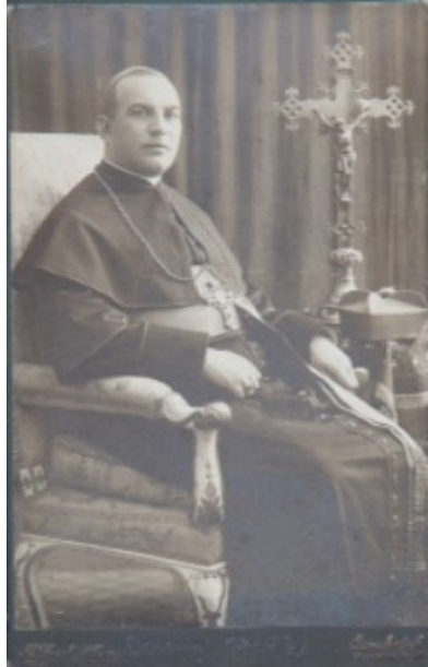
Offizielles Gedenkbild zur Bischofsweihe am 29.09.1914