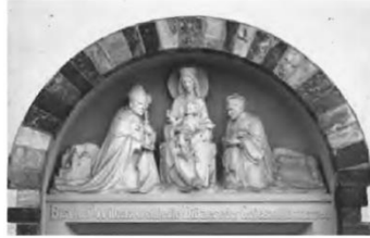
Tympanon über dem Eingang zur Ulrichskirche (Emil Niede, 1942): Bischof Berning stellt 1940 das Bistum angesichts von Nazi-Herrschaft, Krieg und Gewalt unter den Schutz Marias

In den Jahrzehnten nach dem Krieg wurden im Blick auf das geistliche Profil der Ruller Wallfahrt dann vielfältige neue Akzente gesetzt, auf die ich nicht weiter eingehen kann. 57 Die Pfarr- und Wallfahrtskirche selber spiegelt jedenfalls heute nach einer grundlegenden Umgestaltung zu Beginn des Jahrtausends 58 mittlerweile das durch die Weichenstellungen des Zweiten Vatikanums reformierte Gottesdienstverständnis sehr gut wieder. So ist u. a. der Taufbrunnen an eine herausgehobene Stelle gewandert. Von daher noch kurz zu einer letzten Station: