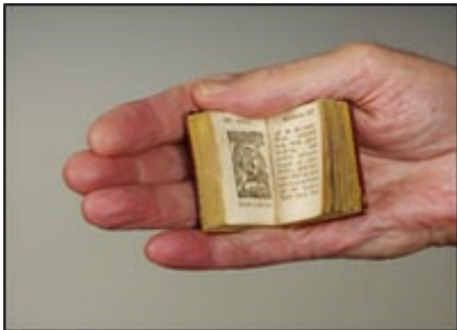
Abb. 2 History of the Bible, Lansingburgh 1824

Zweitens: Der Begriff ist die Bezeichnung für ein literarisches Genus : ein religiöses Buch für die Hand der Kinder. Dabei handelt es sich um einen literaturwissenschaftlichen Begriff.