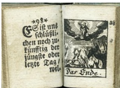
Abb. 7 „Das Ende“. Bild zum jüngsten Tag, in: Ganshorn, Biblia von 1705, 98/99

neutestamentliche Teil der „Biblia“ ist untergliedert in zwei Teile. Buch IV enthält Texte zur Person und zur Botschaft Jesu. Im Buch V werden Texte zum jüngsten Gericht und Weltende dargeboten. Inhaltliche Schwerpunkte sind dabei einerseits die Kindheitsgeschichten, die Passion, die Auferstehung und die Himmelfahrt, andererseits das Ende der Welt und das jüngste Gericht. Im Vergleich zu den anderen Büchern ist dieser Teil ziemlich umfangreich gehalten. Die Gerechten und Auserwählten gehen ein „ins ewige Leben“, die Gottlosen und Verdammten werden „in das höllische Feuer verstoßen, allda ... ohne einziges Aufhören gemartert, gepeinigt und gequälet zuwerden ewiglich“. Mit diesen Worten endet die Daumen-Bibel.