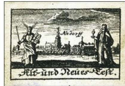
Abb. 8 Frontispiz, in: Ganshorn, Biblia von 1705

Das Bild- und Textprogramm der „Biblia“ von 1705 sind gut aufeinander abgestimmt. Die Verwendung der typologischen Methode beim Bibelgebrauch und der Verzicht auf eine anthropomorphe Darstellung Gottes sind wichtige Merkmale der Altdorffer „Biblia“. Diese theologischen Positionen ermöglichten es dem Verfasser der „Biblia“ von 1727, an die deutsche Miniaturbibel anzuknüpfen und sie im Rahmen einer reformiert-puritanisch ausgerichteten Theologie aufzunehmen und weiter zu entwickeln. Dabei wurde die Typologie weiter ausgebaut und die Periodisierung der Heilsgeschichte in die drei großen Zeitalter (vor dem Gesetz – unter dem Gesetz – unter der Gnade) weiter entfaltet.