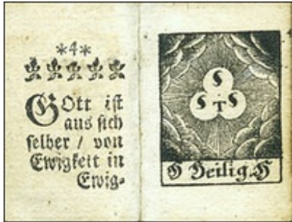
Abb. 5 „Heilig-Heilig-Heilig. Symbolbild zur Trinität, in: Ganshorn, Biblia von 1705, 4/5

Der alttestamentliche Teil ist untergliedert in ein Buch II, das der Schöpfungsthematik gilt, und ein Buch III, das sowohl auf die Erzväter, als auch auf die Propheten und ihre Weissagungen des Messias eingeht. Dem Text sind ein Symbolbild zur Schöpfung durchs Wort und ein Bild von Aaron als Vertreter der Priesterschaft beigegeben.