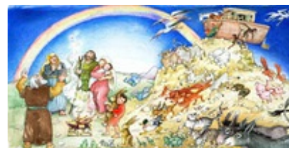
Abb. 9 Heinemann, Horst, Hosentaschenbibel, Fuldata 4. Aufl. 2011, Abb. 3.