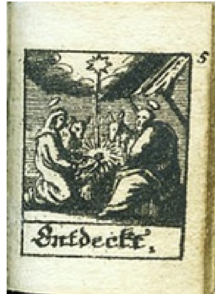
Abb. 6 „Entdeckt“. Bild zur Geburtsgeschichte, in: Ganshorn, Biblia von 1705, 50/51

neutestamentliche Teil der „Biblia“ ist untergliedert in zwei Teile. Buch IV enthält Texte zur Person und zur Botschaft Jesu. Im Buch V werden Texte zum jüngsten Gericht und Weltende dargeboten. Inhaltliche Schwerpunkte sind dabei einerseits die Kindheitsgeschichten, die Passion, die Auferstehung und die Himmelfahrt, andererseits das Ende der Welt und das jüngste Gericht. Im Vergleich zu den anderen Büchern ist dieser Teil ziemlich umfangreich gehalten. Die Gerechten und Auserwählten gehen ein „ins ewige Leben“, die Gottlosen und Verdammten werden „in das höllische Feuer verstoßen, allda ... ohne einziges Aufhören gemartert, gepeinigt und gequälet zuwerden ewiglich“. Mit diesen Worten endet die Daumen-Bibel.