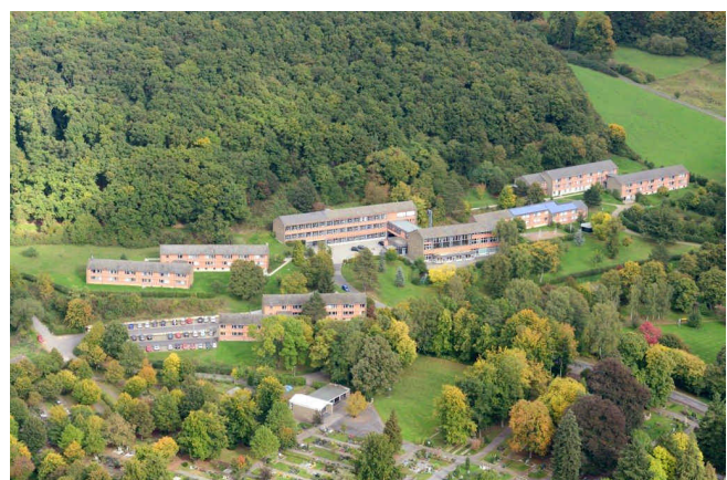
Luftaufnahme von der Fachhochschule

im Fach Kriminologie vollzugsspezifisch vertieft und erweitert. Die Studieren-