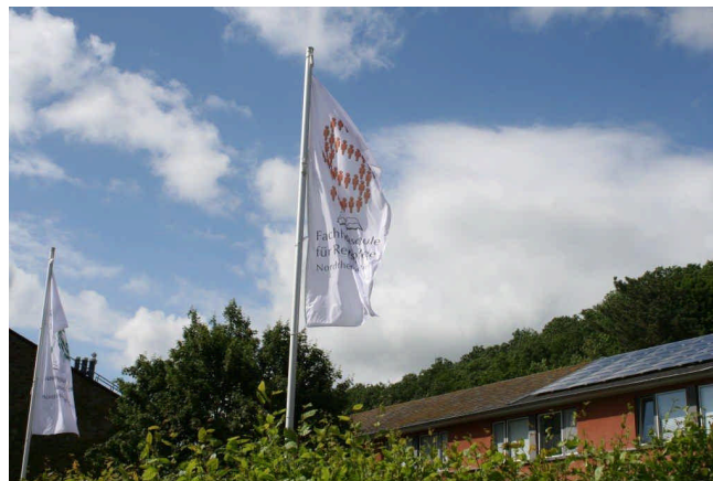
Fachhochschule für Rechtspflege Nordrhein-Westfalen in Bad Münsterfeld

tung gelten die Grundsätze der Wirtschaftlichkeit und Sparsamkeit (§ 6