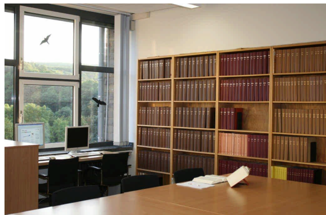
Fachhochschule für Rechtspflege Nordrhein-Westfalen in Bad Münsterneifel

nige auskennen. Die Studierenden der Fachhochschule gehören dazu.