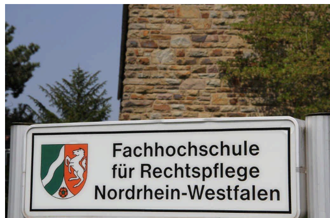
Fachhochschule für Rechtspflege Nordrhein-Westfalen in Bad Münstereifel

Bei den Studierenden im Fachbereich Strafvollzug ist die Spannweite noch weiter als bei den Lehrkräften. Natürlich gibt es Abiturienten. Daneben finden sich aber auch Studierende, die bereits über