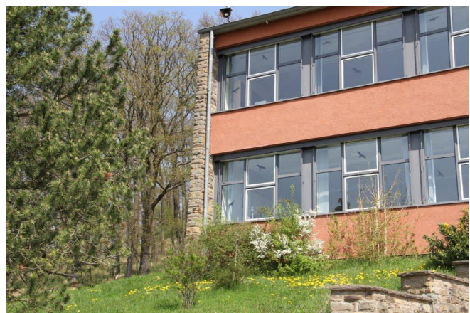
Fachhochschule für Rechtspflege Nordrhein-Westfalen in Bad Münsterfeld

Freiheitsstrafe. 4 Es gilt also das geflügelte Wort: „Und morgen sind sie wie-