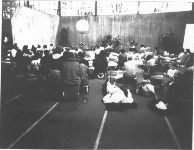
Musik und Meditation

song), zielt die therapeutische Musik auf die Heilung von Schädigungen aller Art, auf die Stabilisierung der Identität, auf eine ganzheitlichere Lebensweise und auf mehr Lebensfreude. Dies allerdings nicht als Flucht vor den wahren Problemen (dann wäre die Therapie unzulässig gegen die Diakonie ausgespielt), sondern als Ergänzung zur diakonischen Sozialtherapie. (Auf die anderen Dimensionen der Musik, nämlich Prophetie, Liturgie und Glossolalie, kann ich in diesem Zusammenhang nicht näher eingehen.(32))