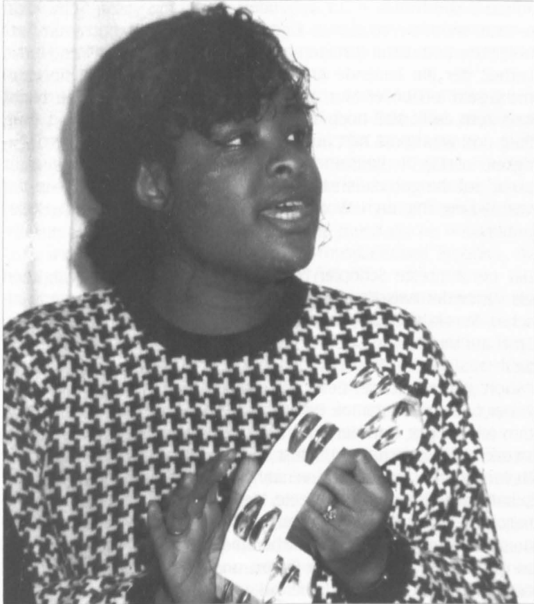
Tanzende Liturgie, interkulturelles Wochenende in Schloß Craheim mit farbigen Christen aus Birmingham

Eine etwas andere Funktion erhält die Musik in den sogenannten Kultur- und Hochreligionen: Sie dient nun der persönlichen Verständigung zwischen Mensch und Gott, wird zum Kommunikationsmittel vor allem zwischen Priester und Gottheit. Musik spielt