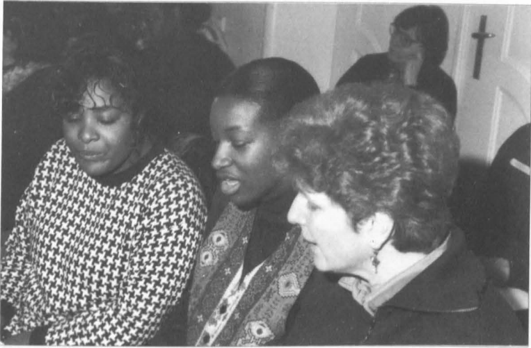
Kirchenmusik verbindet

Musikerlebens bedeutet dies, daß langfristig vom Hören und Spielen einfachster archetypischer Musik zur Wahrnehmung bzw. zum Spielen künstlerisch gestalteter Musik fortgeschritten werden sollte. Der therapeutische Auftrag der Kirchenmusik verbindet sich daher mit musikpädagogischem Engagement sowie der Pflege der gewachsenen Musikkultur in Kirche wie Gesellschaft.