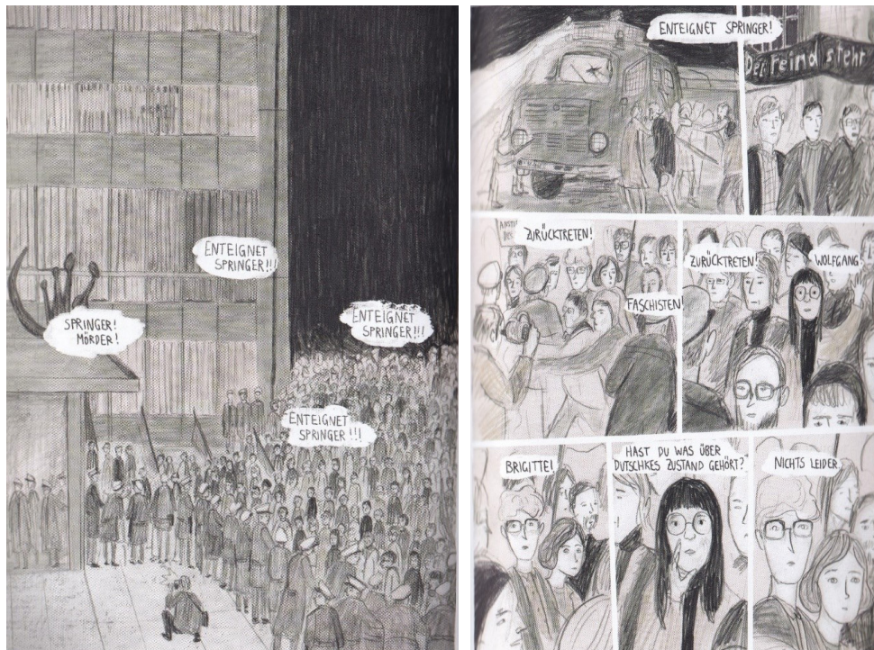
Abb. 2: Subjektives Figurenerleben in der Graphic Novel Drei Wege (Zejn 2018, 120f.)

Im Folgenden analysiere ich exemplarisch eine Aufgabenbearbeitung aus dem Le-seportfolio des Schülers Demian 5 nach diesem Schema in verkürzter Form. Auf die Grundlagen der multimodalen Textanalyse werde ich hier nicht nochmals eingehen, vielmehr soll deren Leistung für die Beschreibung von Text-Bild-Wahrnehmungen aufgezeigt und konkretisiert werden. Demian konzentriert sich intratextuell auf die ‚Storyworld‘ (Packard et al. 2019) um Marlies, eine Arbeitertochter, die gern anstelle der von den Eltern für sie vorgesehenen Heirat eine Buchhändlerlehre aufnehmen möchte. Marlies verliebt sich – damit befinden wir uns auf der Ebene des pragmatischen Rahmens – in einen linken Studenten, der sich im Sozialistischen Deutschen Studentenbund (SDS) engagiert, und gelangt so mitten in die politischen Konflikte, die im untenstehenden Panel (Abb. 2) visualisiert sind. Der Text ist von einer Autorin im Jahre 2018 produziert, d.h. hinsichtlich des zu antizipierenden Verständnisrahmens spielt neben den intertextuellen Verknüpfungen um die 1968er und die Erinnerungskultur zum SDS auch die gesellschaftliche Verhandlung von Emanzipation und der Rolle der Frau eine Rolle.