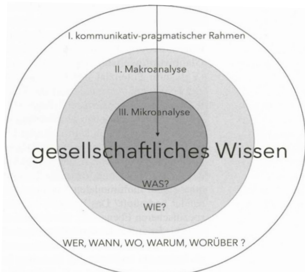
Abb. 1: Multimodale Text- und Diskurssemantik (Klug 2017, 77)

Mit Blick auf die kreative Schreibaufgabe zu Julia Zejns Drei Wege waren in einer ersten Inhaltsanalyse mit deduktiv-induktiver Kategorienbildung (vgl. Kuckartz 2018) Erzählerfiguren und Figurenschreiblichkeit als stark gesättigte Kategorien der Text-Bild-Wahrnehmung identifizierbar, hier ergaben sich jedoch beträchtliche Unterschiede in der Bearbeitung der unterschiedlichen Zeichenressourcen, die mit der qualitativen Inhaltsanalyse nur schwer erfasst bzw. kodiert werden konnten. Daher wurden die Aufgabenbearbeitungen einer weiteren diskurssemantischen Analyse (angelehnt an die verschiedenen Ebenen nach Klug 2016, 171f.) unterzogen. Dafür wurde auf der Gegenstands- und der Rezeptionsebene nach dem Analyseschema von Nina-Marie Klug (2016; 2017) vorgegangen (siehe Abb. 1):