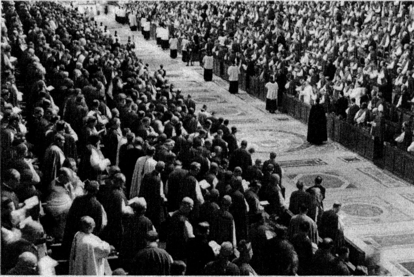
Das Zweite Vatikanische Konzil hat eine ganz neue Erfahrung von Weltkirche eröffnet.

Zukunft der einen Welt einen neuen, nachhaltigen Lebensstil einzuüben und mit den immer knapper werdenden Ressourcen verantwortlich umzugehen.