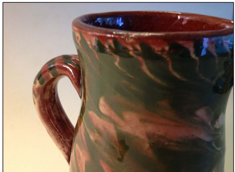
Abb. 7 Henkelkanne, glasierte Irdenware mit rotem Bruch, freigedreht, einfacher, leicht ausbiegender Rand, weiß-braune Marmorierung auf der Gefäßbaußenseite, beidseitig transparente Glasur, H 16,2 cm, Sammlung Prof. B. Kerkhoff-Hader (Bonn).