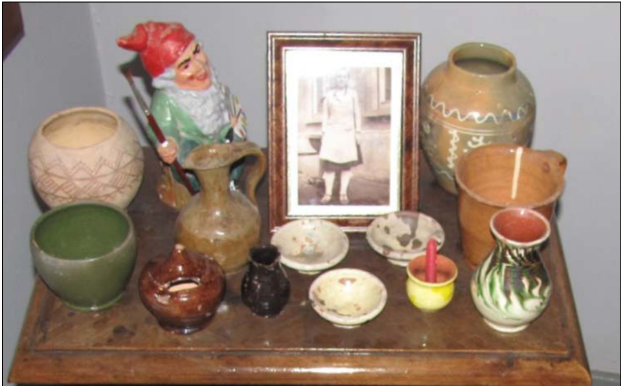
Abb. 6 Vase (rechts, vordere Ecke), Häfnermuseum Aichtal, glasierte Irdenware mit rotem Bruch, freigedreht, einfacher, leicht ausbiegender Rand, Gefäßbaußenseite cremeweiß engobiert, grün-braune Marmorierung auf der Gefäßbaußenseite (obere Hälfte des Gefäßes), beidseitig transparente Glasur.