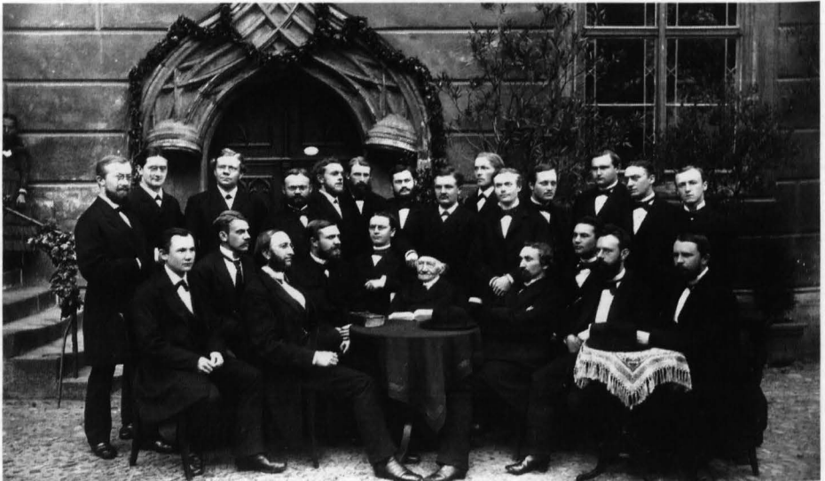
Die Seminarscholarship im Predigerseminar im Lutherjahr 1883 (vor der Lutherhalle).

Der Besuch des Predigerseminars wurde damit noch nicht verpflichtend für alle, entwickelte sich jedoch von einer Eliteanstalt für einige wenige zu einer regulären Ausbildungsstätte für viele. Wittenberg wurde jedoch nicht in ein Seminar für die Provinz Sachsen umgewandelt, sondern blieb, was es von Anfang an war, ein Seminar der preußischen Union, das Kandidaten aus allen preußischen Provinzen offenstand.