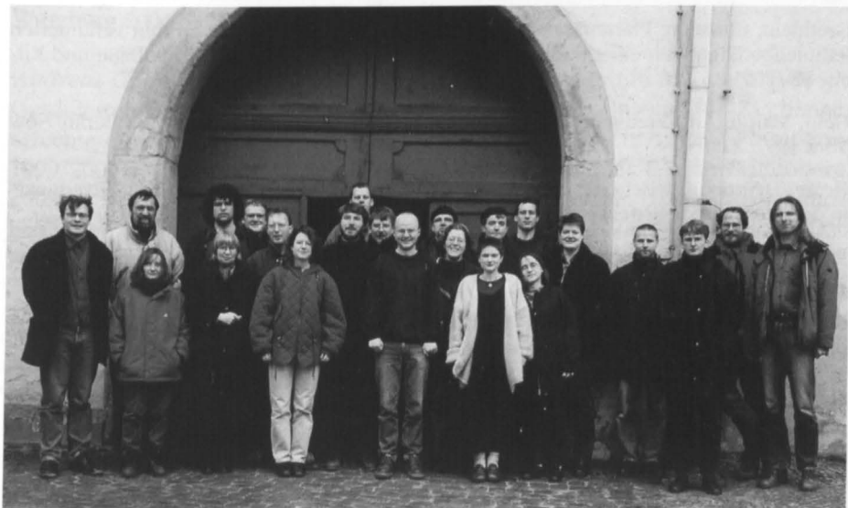
Seminargemeinschaft im Predigerseminar im 500. Jubiläumsjahr der Leucorea 2002 (vor dem Augusteum)

Und so bleibt das Predigerseminar auf Luthers Grund und Boden angesichts der Herausforderungen der Zeit der Freiheit des Evangeliums verpflichtet.